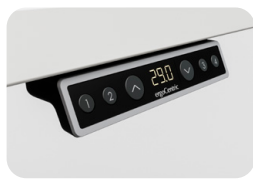
Positions de Mémoire Pré réglables