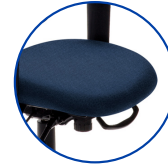
Siège avec coutures