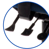
Différentes hauteurs de siège sont disponibles