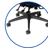
Plusieurs choix de sièges, roulettes et accoudoirs offerts en option