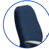
Dossier anatomique entièrement rembourré