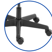
Plusieurs options de levage et de roulettes