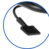
Hauteur du siège